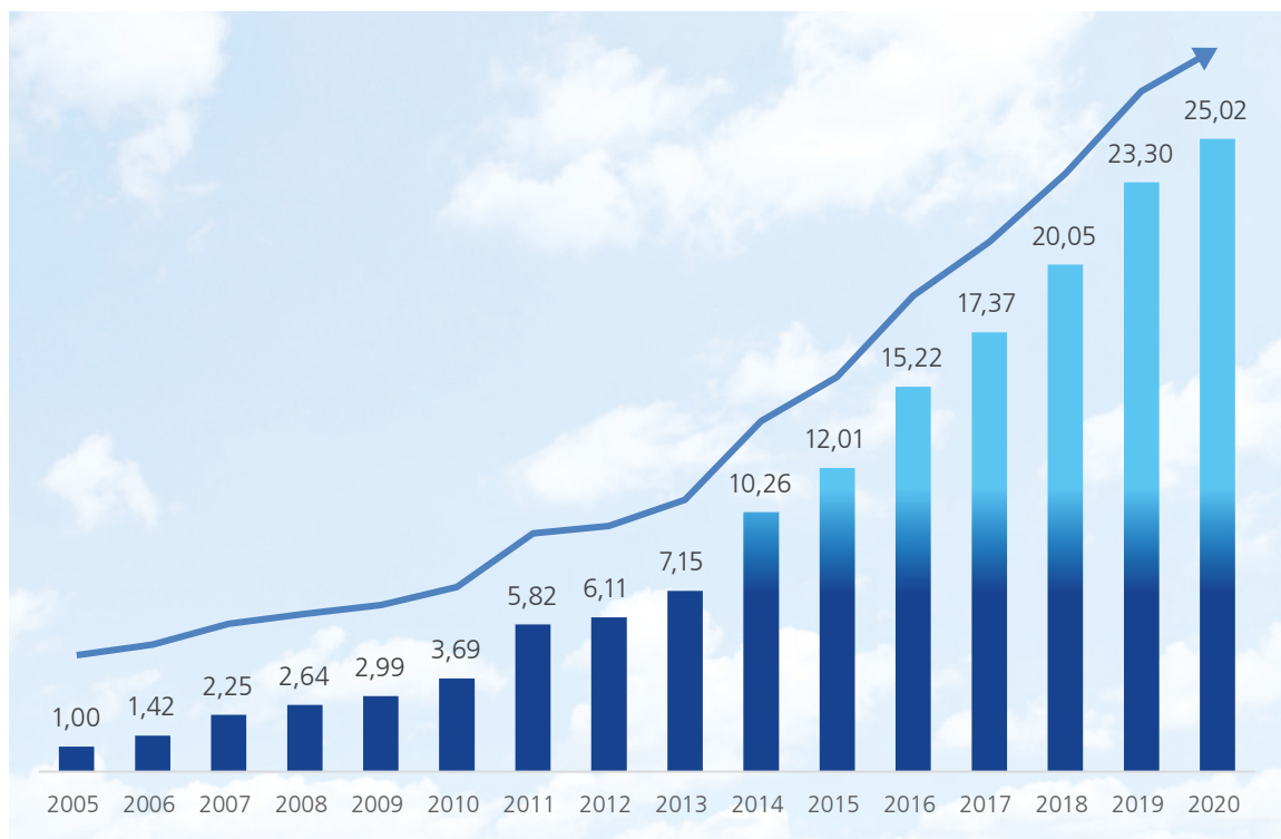
Kursudvikling EgnsINVEST Holding aktien

Kursen på aktien er siden 2005 steget med 2.402%. De meget tilfredsstillende resultater har EgnsINVEST opnået inden for forretningsområderne investeringsforeningsvirksomhed, strukturerede produkter, vindenergi med aktiviteter i Danmark, Sverige og Tyskland samt ejendomme i Tyskland og Danmark.